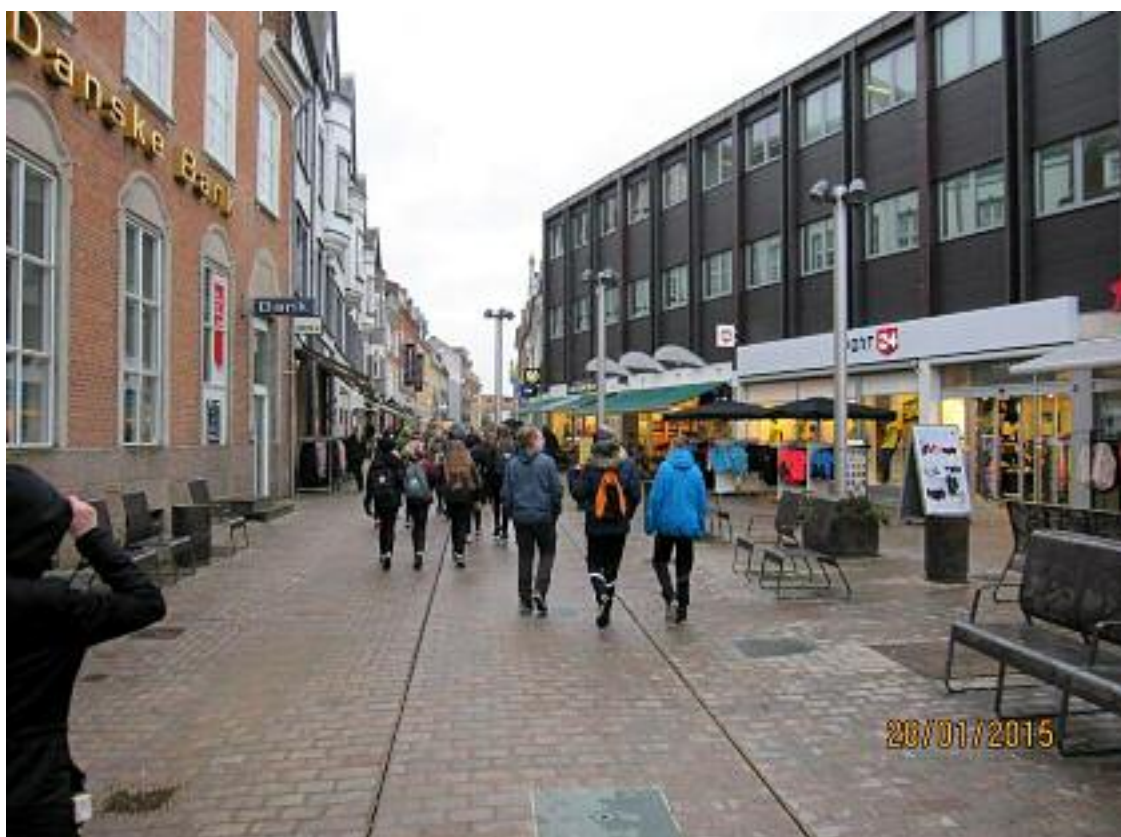
Konfirmander på tur i Viborg by