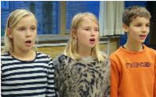
Glæden ved at synge kan ikke skjules

Børnekoeret har gjort det rigtig godt de gange, hvor de har været afsted på gudstjenestebesøg. De optræder fokuseret og modent med deres sang, så kirkegængerne har fået en god oplevelse sammen med gudstjenesten.