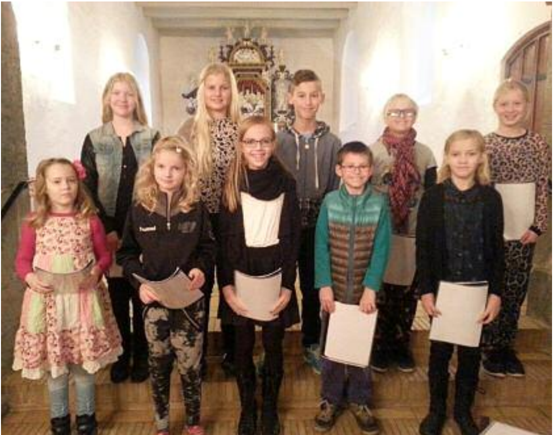
Provstiets børnekor tager ud og synger en gang om måneden i provstiets kirker

Houe-Hygum-Tørring Menighedsråd inviterer til koncerten. Billetter à 100 kr. kan købes ved Shell Tørringhuse, Lemvig Boghandel eller ved indgangen.