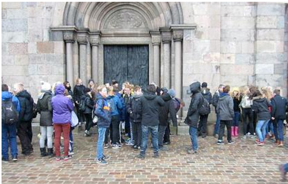
Glade konfirmander foran Viborg Domkirke.