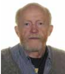
Johannes Vigh Kirkeværges Hove