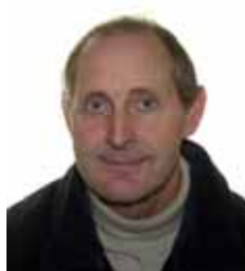
Svend Snebjerg Kirke- og kirkegårdsudvalg, Valgudvalgsformand.